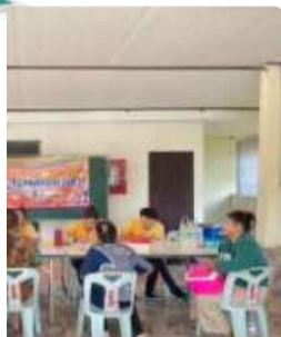
วาร์ปลดโรค คน เกโรคพิษสุนัขบ้า ะมาณ พ.ศ. 2567...