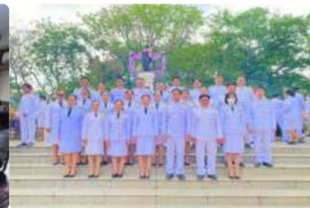
โครงการงานฉลองวันแห่งชัยชนะ ของท้าวสุรนารี...