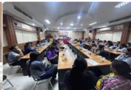
การอบรมให้ความรู้การป้องกัน ควบคุมโรคไข้เลือดออก...