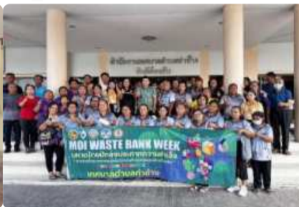
MOI Waste Bank Week “ มหาดไทยป้กรธงประกาศความ สำเร็จ 1 องค์กรปกครองส่วนท้องถิ่น